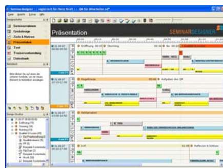
Abb.: Screenshot: „Präsentations-Design“

Das Programm ist zwar übersichtlich und schnell erlernbar, anfangs aber doch gewöhnungsbedürftig, vor allem wenn es um die „Feinheiten“ geht.